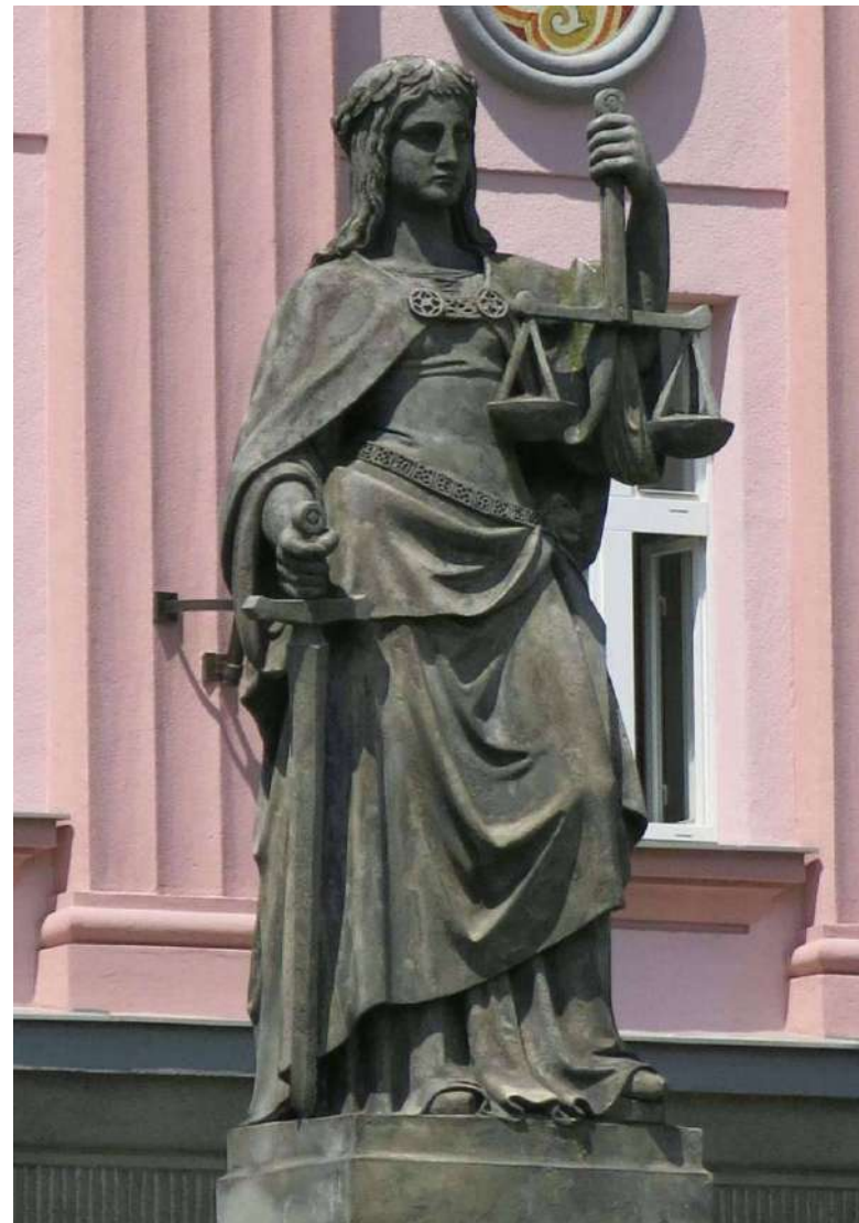
Ve středu pozornosti byl čl. 105 Ústavy [1]

K dané otázce se již ÚS vyjádřil v kontextu předchozího občanského zákoníku. Ve svém usnesení II. ÚS 995/07 uvedl, že „lze vyvodit, že je to rovněž stát, který nese primárně povinnost vykonávat opatrovnictví osoby zbavené způsobilosti k právním úkonům tam, kde nenalezne vhodnou osobu z okruhu příbuzných opatrovance či dalších soukromých osob, které by byly ochotny dobrovolně tuto funkci převzít a s náležitou péčí ji vykonávat“. K závažnosti otázky financování