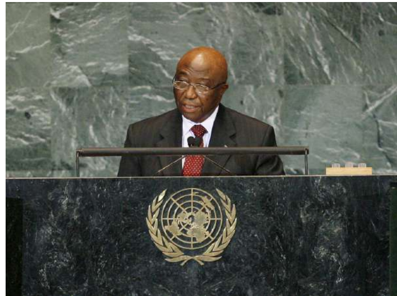
Joseph Nyumah Boakai, prezident Libérie [1]