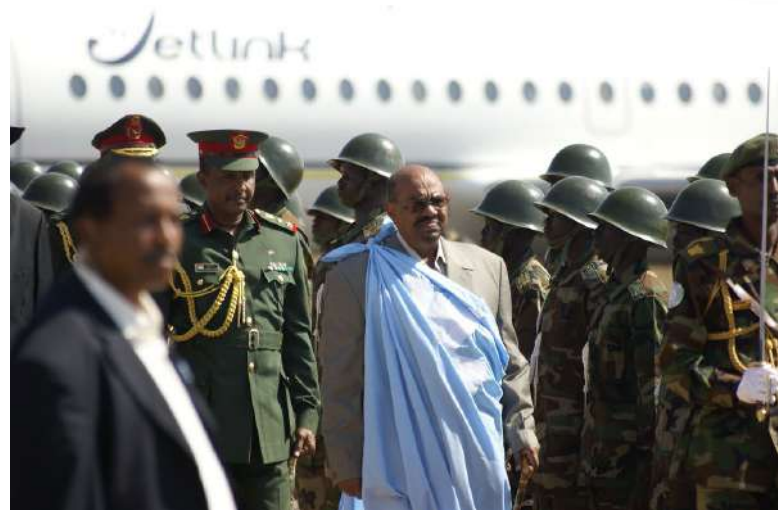
Bývalý prezident al-Bašír nyní čelí stíhání MTS [2]

Od počátků bojů v polovině dubna 2023 muselo údajně opustit své domovy více než deset milionů obyvatel. Přibližně dva miliony uprchlíků utekly do zahraničí, zejména do sousedního Čadu, Egypta, Středoafričské republiky, Etiopie, Libye či Jižního Súdánu. Zbytek obyvatel zůstal vnitřně vysídlený.