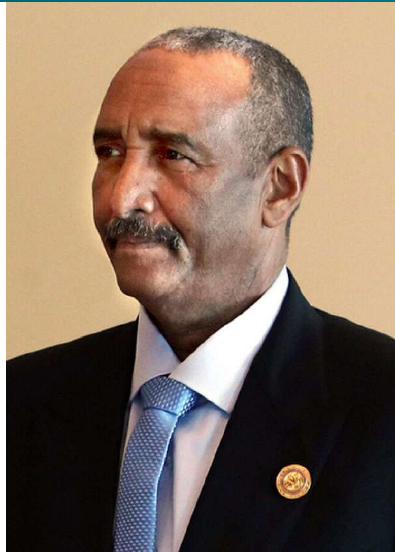
Současný vůdce Súdánu Abdel Fattah al-Burhan [1]

Autoritářský prezident al-Bašír, který zemi vládnul od převratu v roce 1989, byl ze své pozice v roce 2019 svržen. To zpočátku vedlo k demokratizač-