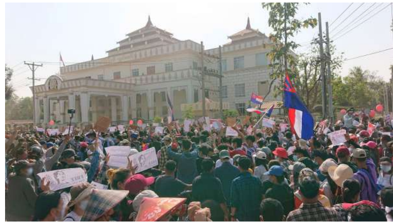
Armáda kontroluje moc v Myanmaru téměř čtyři roky [1]

Úřad OSN pro lidská práva vybízí k tomu, aby byly všechny osoby odpovědné za hrubé porušování lidských práv a závažné porušování mezinárodního humanitárního práva v Myanmaru hnány k odpovědnosti. Vyšetřovací mechanismus je dle jeho vedoucího připraven nashromáždit dostatek důkazů pro řízení u Mezinárodního trestního soudu a Mezinárodního soudního dvora.