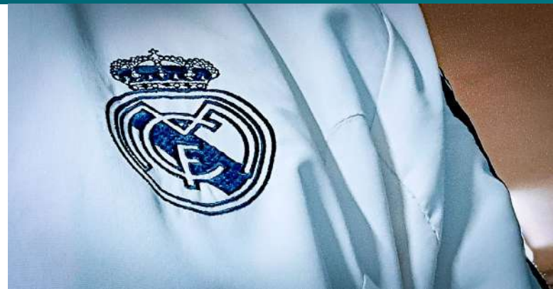
Real Madrid zažaloval francouzský Le Monde za pomluvu [2]

Evropský soudní dvůr rozhodoval v říjnu v případě C-633/2022, Real Madrid Club de Fútbol, AE v EE, Société Éditrice du Monde SA . Hlavní otázkou zde bylo to, jak nalézt správnou rovnováhu mezi náhradou škody za pomluvu, svobodou tisku a uznáváním