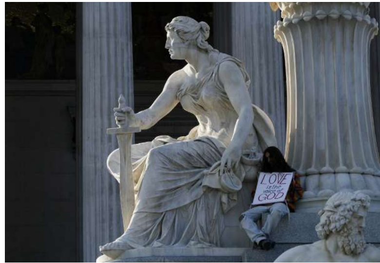
Senát je jedním ze základních prvků brzd a protivah [2]

Většinový volební systém extremistické kandidáty povětšinou vyřadí. Ve druhém kole totiž zpravidla nezískají většinu. Oproti Poslanecké sněmovně, kde na většinu pohodlně stačí i 40 % hlasů, je totiž nutné získat více než polovinu hlasů všech hlasujících, což je pro extremistické kandidáty z povahy věci podstatně složitější. I kdyby se však extremistům zadařilo, nemají vyhráno. Na obsazení větši-