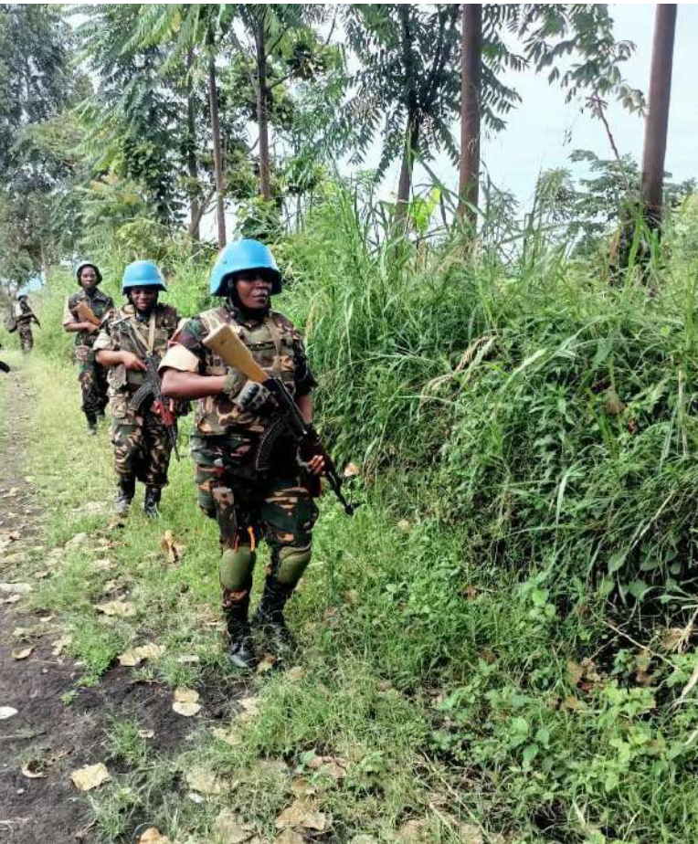
Před ozbrojenými skupinami chránily oblast tanzánské bezpečnostní hlídky [2]

zůstává v chaosu od svržení Muammara Kaddáfího a dvě občanské války během jednoho desetiletí zemi navíc rozdělily na východ a západ, podporované milicemi a zahraničními vládami (viz článek na blogu Centra z května 2022). MTS, který nemá vlastní policejní složky, spoléhá při vynucování zatykačů na spolupráci s ostatními smluvními státy. Prokurátor Karim Khan vyjádřil ochotu úzce spolupracovat s libyjskými úřady, aby obvinění mohli stanout před soudem.