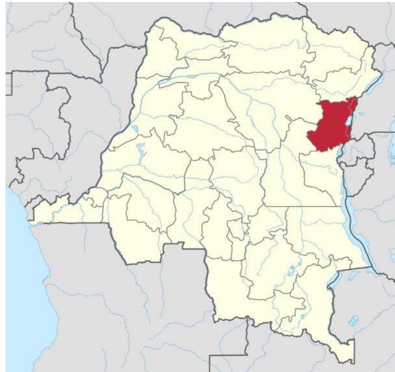
Konžská provincie Severní Kivu je sužovaná ozbrojeným konfliktem [1]

V roce 2023 uzavřel MTS s konžskou vládou memorandum o porozumění, zaměřené na propojení vyšetřování a posílení vnitrostátní odpovědnosti. Obnovené vyšetřování v Kongu zdůrazňuje potřebu dlouhodobé spolupráce mezi mezinárodními a vnitrostátními institucemi v boji proti beztrestnosti. Společné úsilí mezi MTS, konžskou vládou a mezinárodním společenstvím může významně přispět ke spravedlivému postihu závažných zločinů a přinést trvalé řešení pro postižené oblasti.