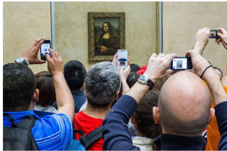
Nadměrná turistika trápí i Paříž [1]

Odborník na odpovědný cestovní ruch Harold Godwin jmenuje jako příčinu vzestup nízkorozpočtových cestovních kanceláří a leteckých společností. Rostoucí poptávka po cestování je ovlivněna i tím,