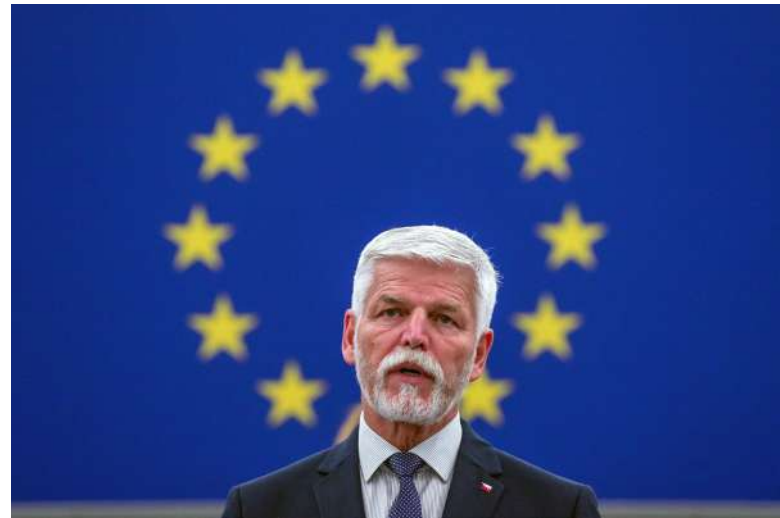
Prezident Pavel vetoval návrh zákona, kterým by se omezila účast laiků na soudním řízení [2]