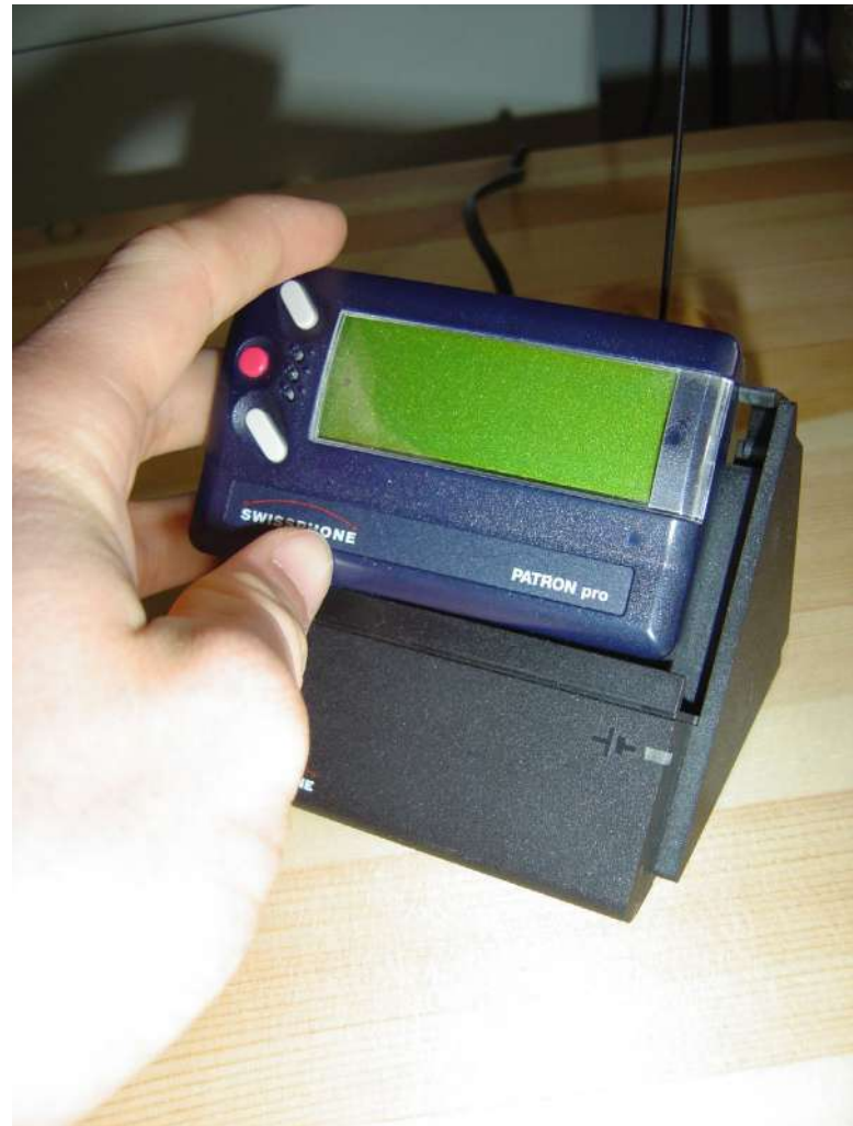
Ilustrativní fotografie pageru [1]

Z tohoto důvodu se na izraelskou operaci zaměřila kritika Vysokého komisaře OSN pro lidská práva, Volkera Türka, který kritizoval čelní představitele Izraele za to, že se zaměřili na tisíce jednotlivců, aniž by věděli, kdo měl pagery pod kontrolou a kde se v době útoku nacházely. Türkovo vyjádření naznačuje, že útoky mezi civilisty a kombatanaty nerozlišovaly, a tudíž nebyly v souladu s MHP. Nicméně, tato problematika není tak jednoduchá, jak by se z předchozího tvrzení mohlo zdát.