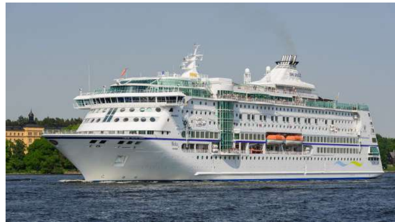
Lodní turistika představuje zátěž pro přírodu [3]

Xavier Mas de Xaxàs (2024, 19. srpna). My Barcelona is being destroyed by mass tourism – but kicking visitors out isn't the answer. The Guardian . Získáno z https://www.theguardian.com/commentisfree/article/2024/aug/19/barcelona-mass-tourism-visitors-city-industry