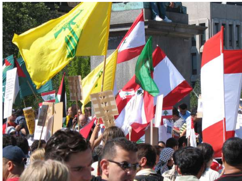
Vlajka Hizballáhu [4]