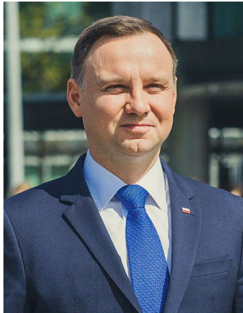
Polský prezident je připraven případný zákon vetovat [4]

Polský zákaz potratů je jedním z nejpřísnějších v Evropě a byl kritizován skupinami na ochranu lidských práv a Evropskou unií. Polsko společně s USA, Salvadorem a Nikaraguou patří celosvětově mezi jediné země, kde došlo ke zrušení možnosti podstoupit potrat. Tento problém vyvo-