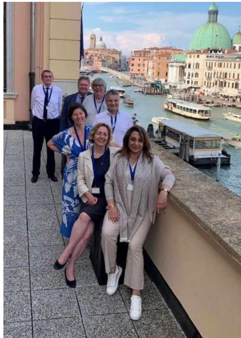
Pracovní komise k bikameralismu [1]

Stanovisko k maďarskému Zákonu o ochraně národní suverenity, na němž pracovala i prof. Bílková, analyzuje na žádost Parlamentního shromáždění Rady Evropy kontroverzní zákon z roku 2023, který provedl změny volební a trestní legislativy a vytvořil nový Úřad na ochranu národní suverenity. Změna volebního práva rozšiřuje zákaz přijímat v souvislosti s volební kampaní peníze ze zahraničí, dosud omezený na politické strany, na další entity, jež ve volbách nominují kandidáty, včetně nevládních organizací. Novelou trestního zákona je pak zaveden trestný čin neoprávněného užití zahraničních prostředků ve volbách (§ 350A). Obě změny jsou údajně motivovány událostí z roku 2022, kdy opoziční strany měly během voleb čerpat prostřed-