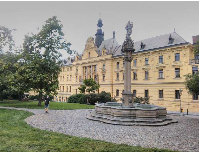
Městský soud v Praze rozhodl v podobné věci zcela odlišně [2]

hodnutí magistrátu ohledně zákazu shromáždění. Své rozhodnutí odůvodnil především tím, že bylo nutné zkoumat povahu hlavního hesla, nikoliv jej automaticky považovat za antisemitské. K výkladu byl přizván i znalec, z jehož posudku vyplynulo, že heslo má až pět různých významů, tudíž na něj nelze pohlížet pouze jako na „unesené“ heslo teroristickou organizací Hamás (viz Bulletin duben 2024, str. 39).