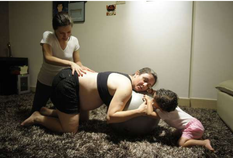
Kvůli současné právní úpravě u domácích porodů častěji asistují duly [2]

Tato právní úprava však podle stěžovatelek vytváří situaci, kdy ženy mohou rodit doma, ale nemohou přitom využít služeb odborně kvalifikované porodní asistentky, protože by jim za vedení domácího porodu hrozila pokuta až jeden milion korun za neoprávněné poskytování zdravotních služeb [3]. Místo toho mohou ženy doma využít pomoci neoprávněných osob, jako jsou duly, na které právní předpisy žádné požadavky nekladou.