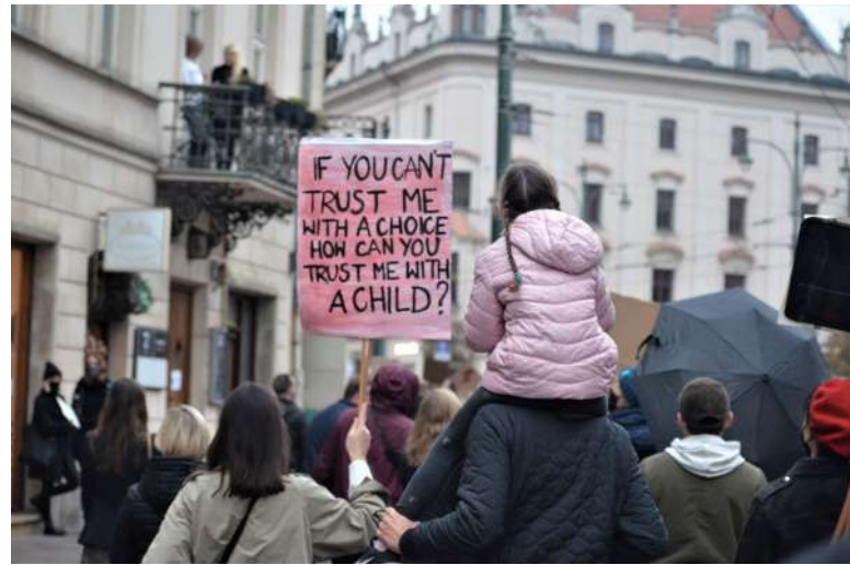
Po rozhodnutí Ústavního soudu v roce 2020 se Poláci vydali do ulic [5]