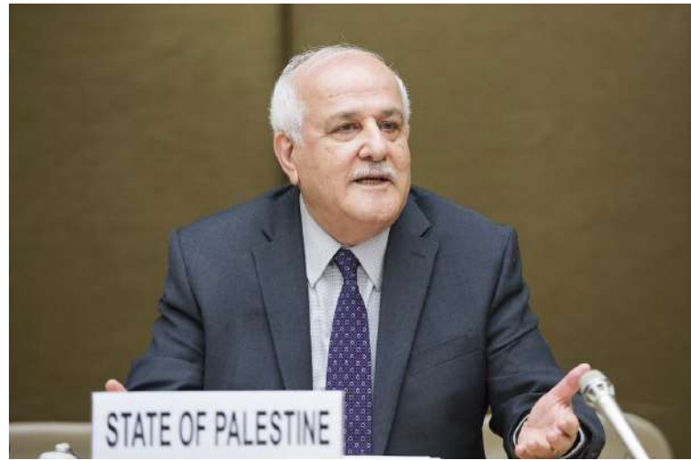
Palestinu v OSN nyní zastupuje Riyad Mansour [1]

V roce 2022 Valné shromáždění OSN požádalo Mezinárodní soudní dvůr (dále „MSD“) o poradní stanovisko ohledně právních následků izraelské okupace palestinských území včetně východního