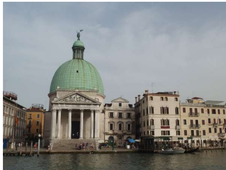
Kostel San Simeone Piccolo v Benátkách [5]

Konkrétně se jedná hlavně o volbu členů NSR, kterou předchozí vláda přenesla ze soudnictví na Sejm, novela pak obnovuje původní systém. Tento krok není zvláště kontroverzní, v souvislosti s ním