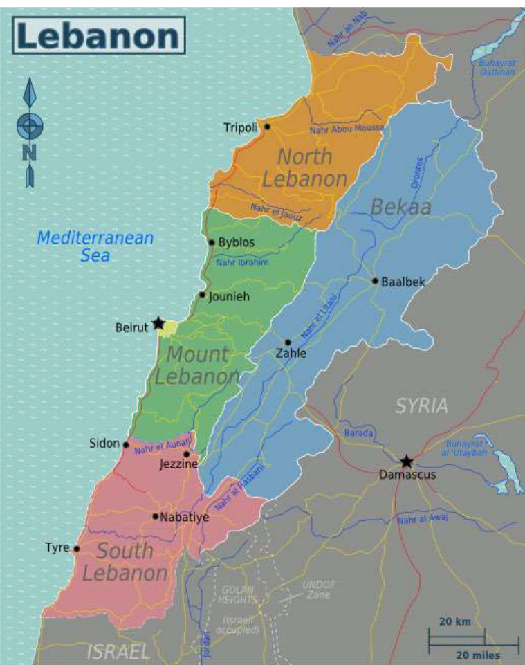
Mapa Libanonu [2]

telských činností. Pokud by tomu tak bylo, pak by aktivace těchto zařízení mohla teoreticky splnit požadavek na princip rozlišení.